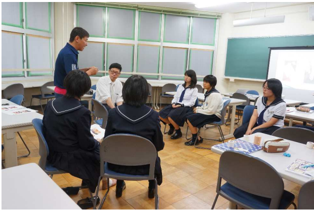
⑥ スポーツ関連の仕事（星城大学）