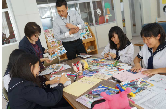
⑦ 旅行・観光関連の仕事（岐阜女子大学）