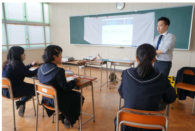
⑤ 理学療法士・作業療法士の仕事（星城大学）