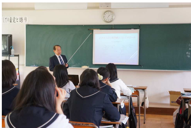
③ 管理栄養士の仕事（修文大学）