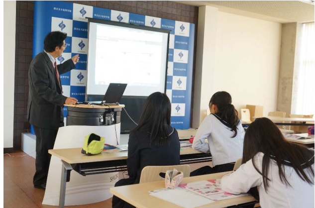
⑬ フードビジネス関連の仕事（名古屋文理大学）

講師の先生方におかれましては、ご多忙のところ本校にお越しいただき、ありがとうございました。