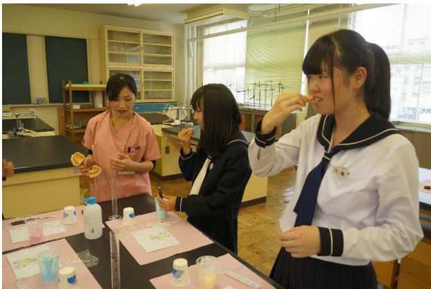
⑩ 歯科衛生士の仕事（名古屋デンタル歯科衛生士学院）

講師の先生方におかれましては、ご多忙のところ本校にお越しいただき、ありがとうございました。